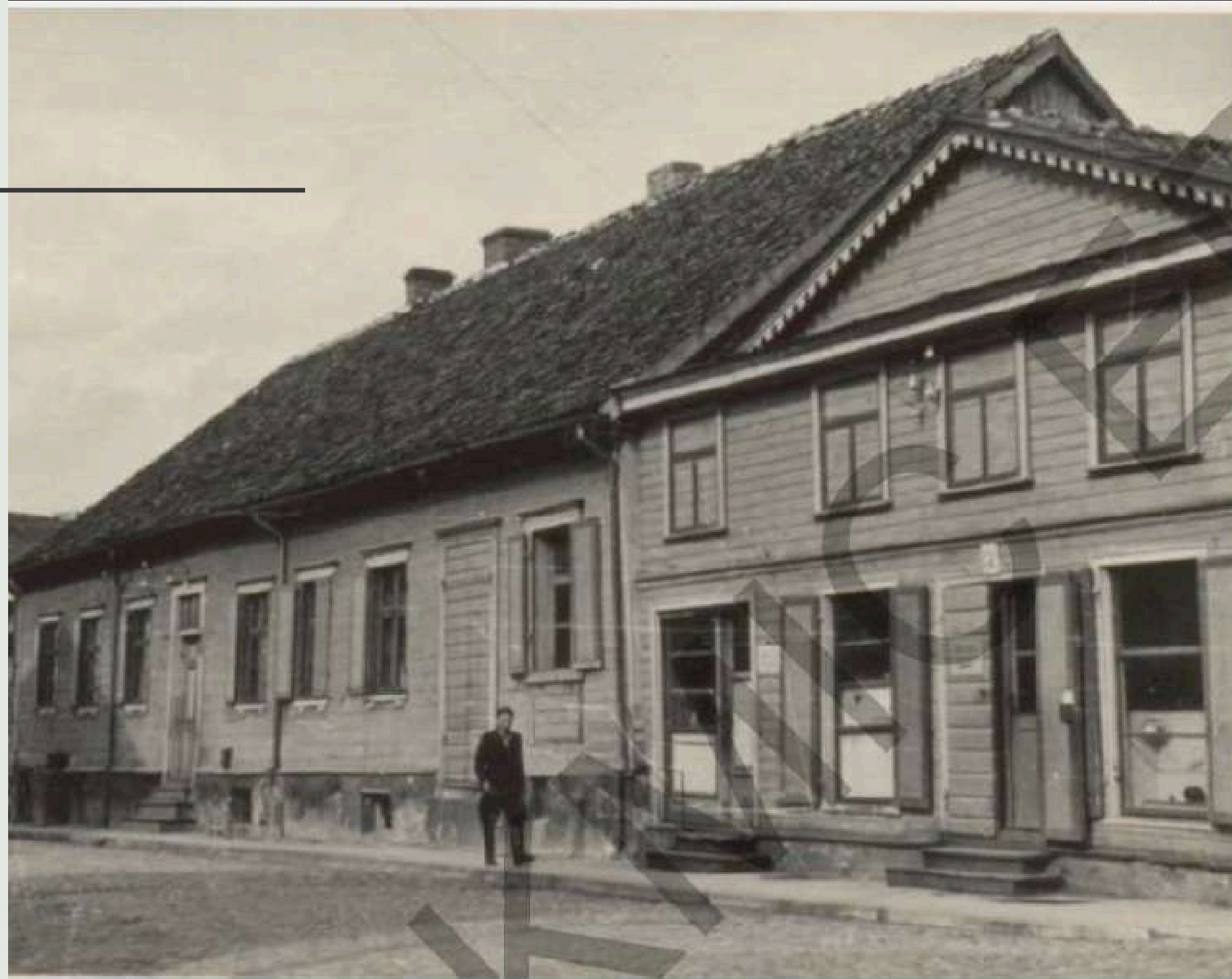
8.attēls Baznīcas iela 17 un 15. Kuldīga. 1949.gads. (Foto:Reinfelds Avots: NMKP PDC arhīvs Lietas Nr.:08-04-III,IV-24-B-1080)

DZĪVOJAMĀ UN TIRDZNIECĪBAS ĒKA, Baznīcas iela 15, Kuldīga